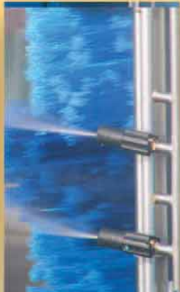
Ugelli a getto laminare.