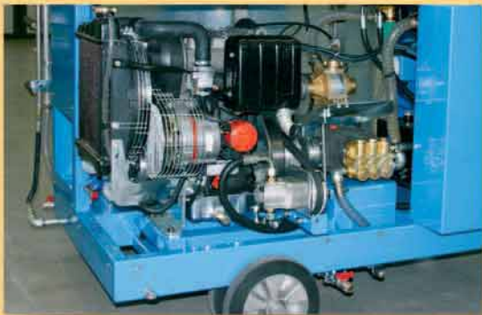
Gruppo motore serie Fullwash con pompa alta pressione

Fullwash motor unit with high pressure pump