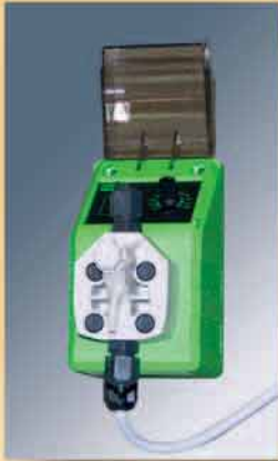
Dispositivo automatico detersivo.

Hydraulic traction with variable speed and extra large wheel.